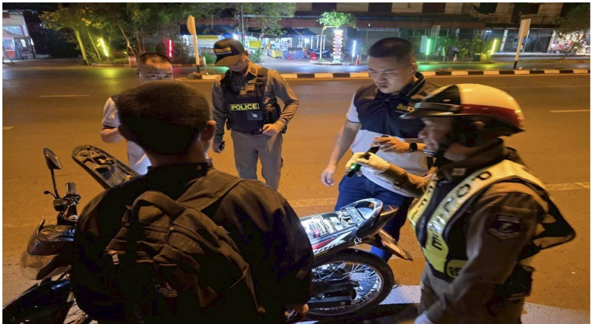
วันที่ 10 เมษายน 2569 จนท.ตร.จราชร,จนท.ตร.สายตรวจ และ ชุดสืบสวนได้ร่วมกันตั้งจุดตรวจเพื่อป้องปรามการทำสิ่งผิดกฎหมาย