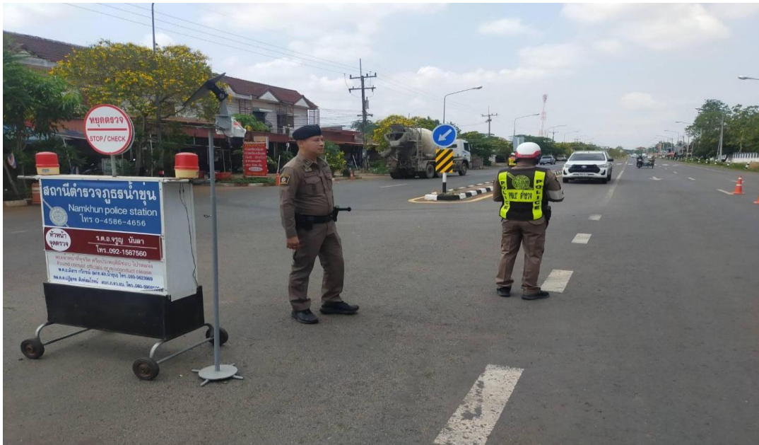
จุดตรวจกวดขันวินัยจราจรเจ้าหน้าที่ตำรวจจราจรปฏิบัติตามแผนการตั้งจุดตรวจฯตามที่ได้ออมนุมัติฯ